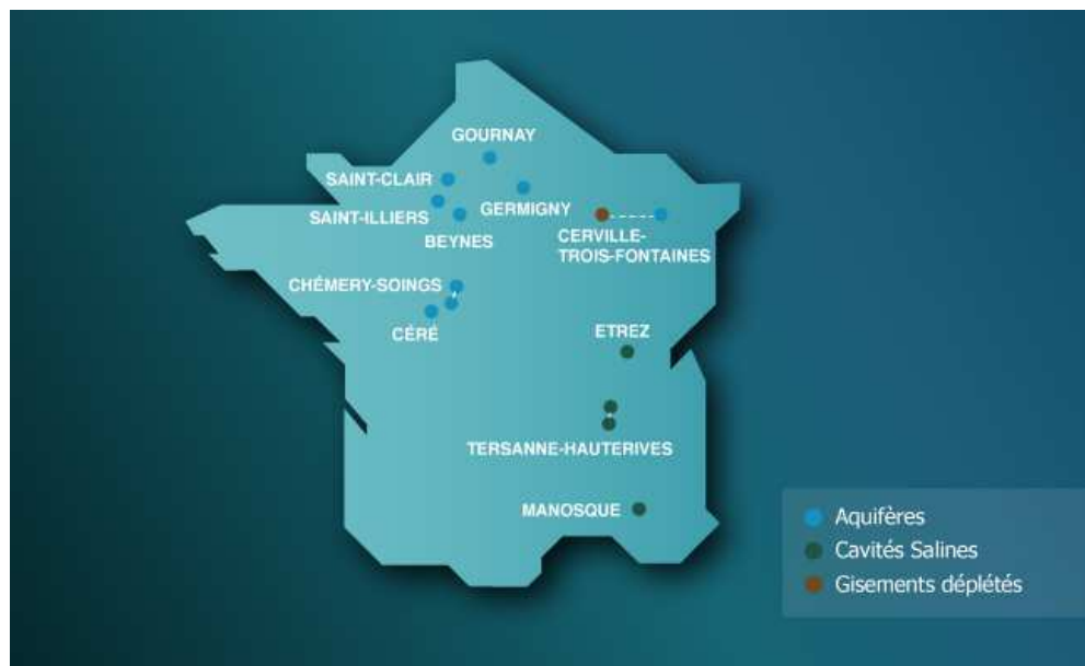
Sites de stockage en France

Répartis sur le territoire et maillon essentiel de la chaîne gazière, les stockages permettent une optimisation des infrastructures gazières et une utilisation plus efficace des réseaux de transport.