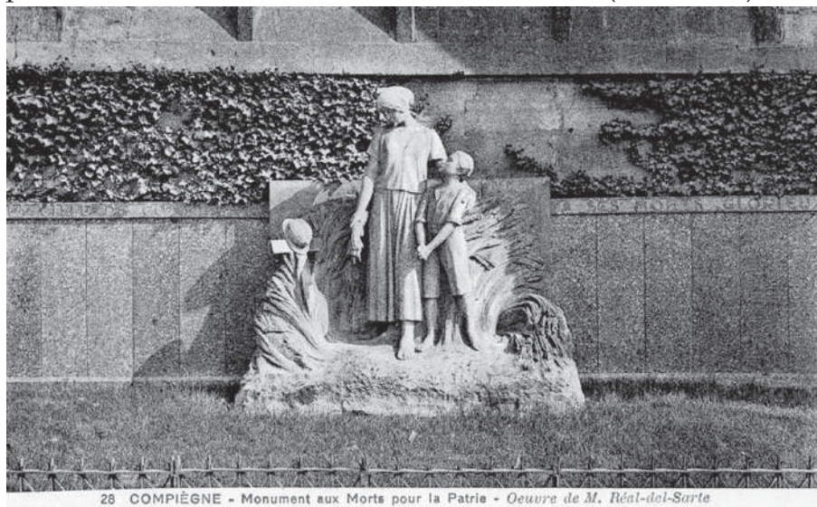
28 COMPIÈGNE - Monument aux Morts pour la Patrie - Oeuvre de M. Réal-dol-Sarte

Pendant le recensement de 1921 n'apporte pas que des informations négatives. Il révèle d'abord une augmentation, certes minime mais réelle, du nombre des jeunes dans la population, les moins de 20 ans passent de 34,4 % à 34,9 %. Les personnes ayant entre 20 et 64 ans ne sont plus que 59,2% contre 66,4%. D'autre part, la population étrangère augmente et passe de 11.760 à 17.695. Les Belges forment encore, et de très loin, la colonie la plus nombreuse, avec 11.191 unités, ils représentent 63,1% de la population étrangère. On ne s'étonnera pas de voir le nombre des Allemands s'effondrer (448 à 39), les