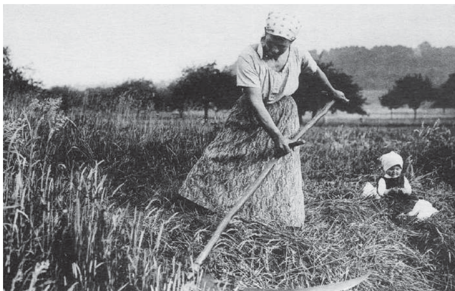
Carte postale avec légende également en anglais et en espagnol : « Nos courageuses Françaises, des pays reconquis dont les fils, les maris, les frères, ont été emmenés en otage, se livrent aux plus durs travaux des champs pour sauver la récolte. Oise 1917 ».

C'est pour répondre aux conditions nouvelles imposées par la guerre que les organisations agricoles oisiennes se dotent d'un organe de presse départemental, là où n'existaient avant guerre que des bulletins par arrondissements. La Défense Agricole publie de février à juin 1915 quelques numéros en dépit des difficultés matérielles et des communications difficiles entre Beauvais et Compiègne où réside son rédacteur en chef Fleurant Agricola. La santé de ce dernier oblige le journal à