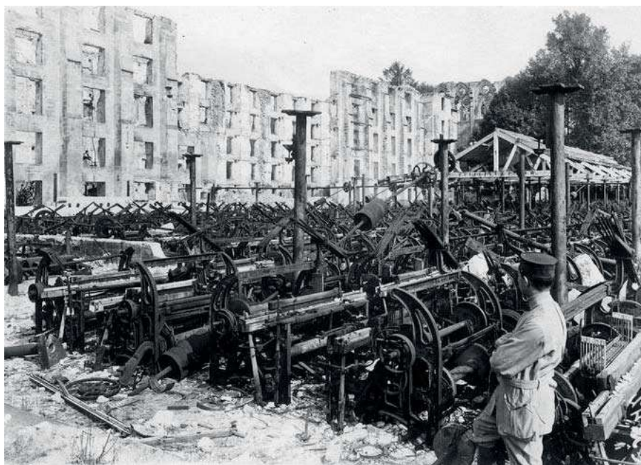
Les bâtiments détruits de la filature d'Ourscamps.

Cette catégorie regroupe la plus grande partie des entreprises du département. Elles sont, en janvier 1917, 127 dans ce cas et emploient 11.717 personnes. Tous les secteurs sont concernés mais pas de la même façon. Les entreprises métallurgiques sont les plus nombreuses, elles voient leurs effectifs gonfler démesurément : Les Forges de Creil emploient 2.000 personnes, celles de Montataire 1732, celles de Beauvais 1076, l'usine de Sérifontaine 1150. Elles n'hésitent pas à se moderniser pour répondre aux demandes de l'armée. Ainsi les Forges et Laminoirs de Creil construi-