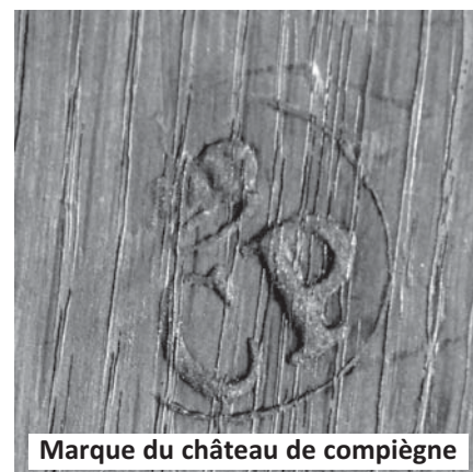
Marque du château de Compiègne

Au lendemain du 10 août 1792, le mobilier du château fut mis sous scellés. L'essentiel devait être dispersé lors des ventes organisées du 1 er septembre 1795 au 14 décembre 1795. Mais il fit aussi l'objet de remplois.