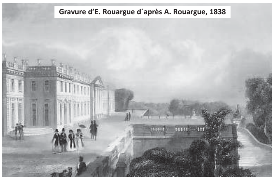
Gravure d'E. Rouargue d'après A. Rouargue, 1838

Sous le Directoire, le château servit à nouveau de caserne de manière ponctuelle et transitoire. À partir du 18 août 1798, le premier bataillon de l'Oise s'y installa. En effet, en application de la loi Jourdan ayant instauré la conscription, le château devint le lieu de rassemblement des conscrits du