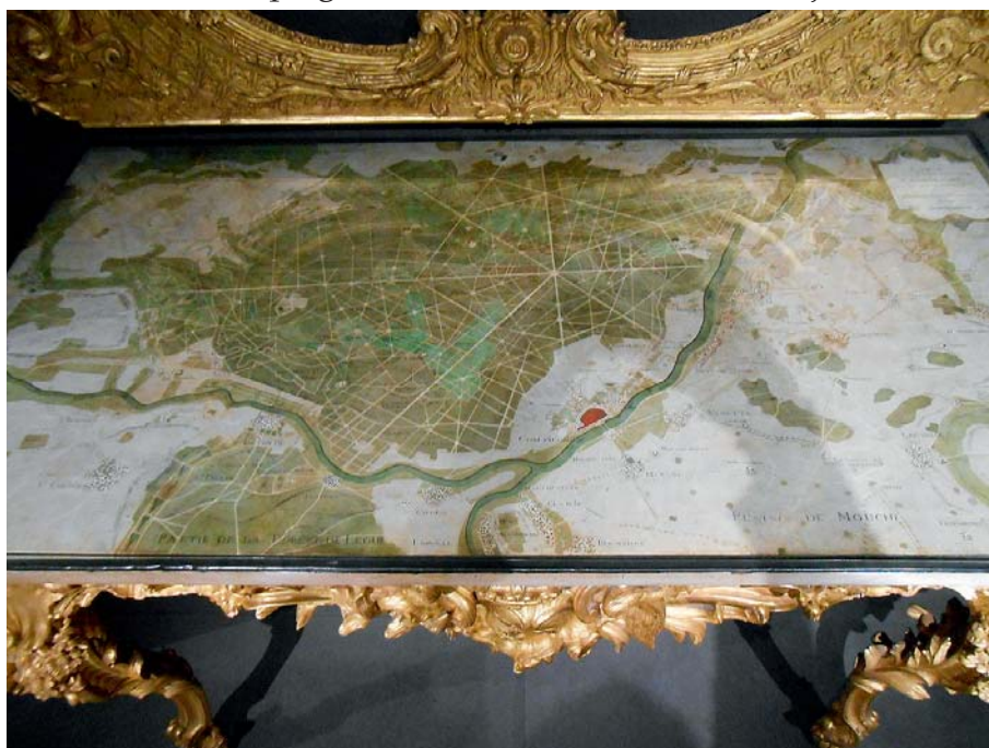
Table des Chasses de Louis XV représentant la forêt de Compiègne (1730)

La sauvegarde du château s'inscrivit dans une logique d'appropriation. La qualité de l'édifice fut reconnue par la municipalité, la présence de la Cour et les travaux du château avaient contribué au développement de la ville. Il y avait là un fort marqueur d'identité, excluant tout vandalisme. Il s'agit alors de rétablir un lien entre la ville et le château, qui avait été brisé par chute de la royauté 25 . La mise au service des habitants de l'édifice fut alors la justification