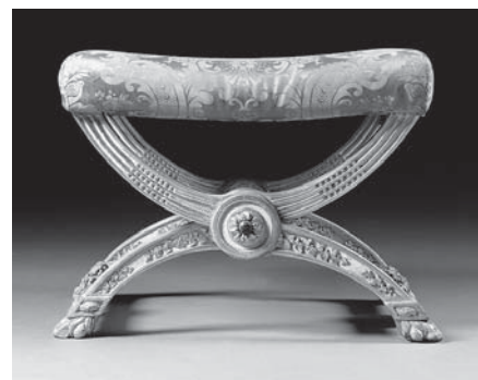
Pliant de Jean-Baptiste-Claude Séné (1748-1803) réalisé vers 1786-1787, vente Sotheby's du 7 juillet 2010