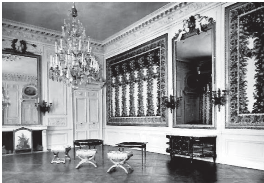
Le salon de jeux de la reine Marie-Antoinette

Le château abriterait le Roi, la Reine et les princes ; les hôtels des ministres et des princes pouvaient être utilisés par leurs occupants. Les députés seraient installés dans le couvent des Jacobins, dont l'église servirait de lieu des séances des différents ordres. Les députés n'ayant pas pu trouver place aux Jacobins pourraient être installés dans les couvents des Cordeliers, des Minimes, et des Capucins. Il était aussi envisagé de réquisitionner l'abbaye de Saint-Pierre et le château de Monchy en fonction des besoins. Les officiers municipaux de Compiègne estimaient être en mesure de loger entre 1000 à 1200 personnes à peu de frais 5 . Le Dreux réalisa à cette fin un