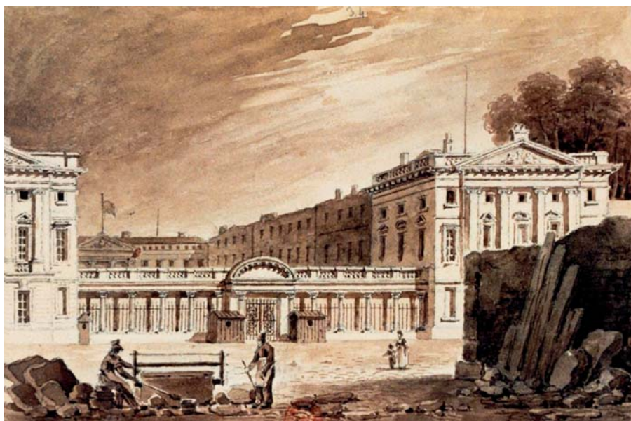
Entrée du château vers 1800, tailleurs de pierre

Ce furent avant tout les usages liés aux problèmes d'ordre public qui s'imposèrent du fait du contexte de guerre. Vaste bâtiment, en partie vidé après la vente du mobilier, assez fermé, le château situé en périphérie de la ville, permettait de contenir plus aisément les risques de désordre.