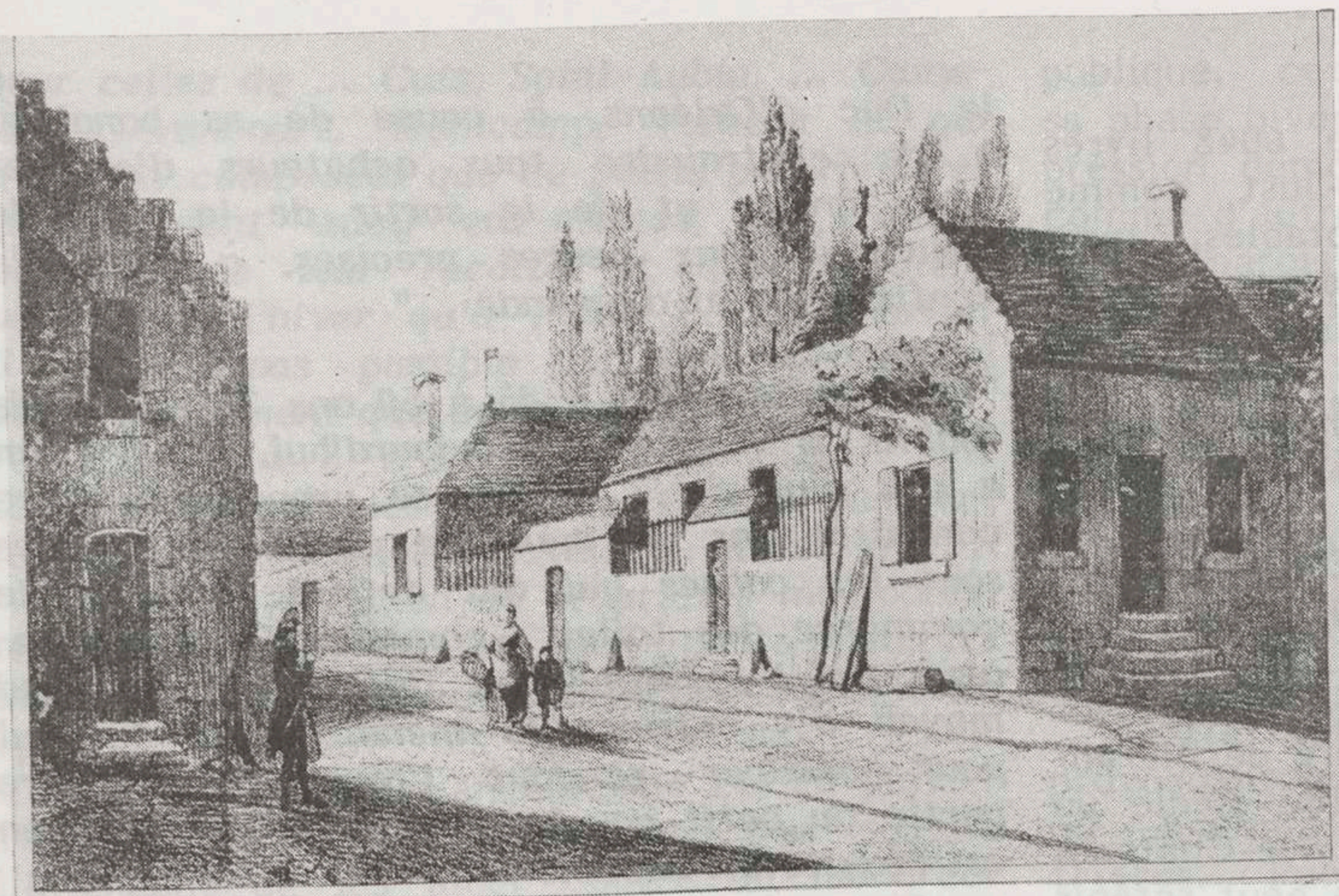
La maison des Saint-Just à Blérancourt, gravure du XIXe s